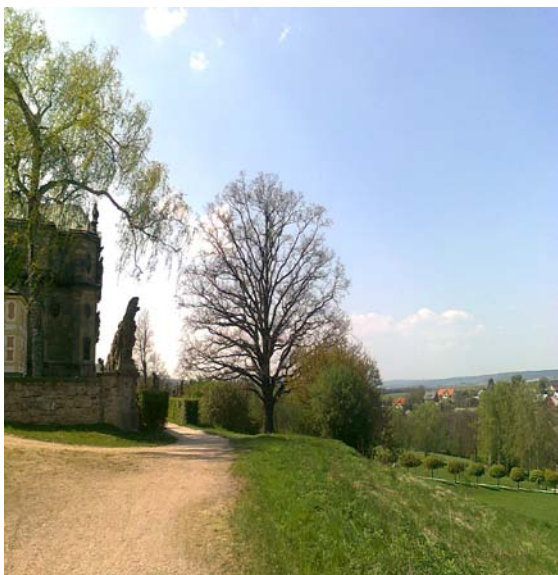
1. Cesta k sochám „Ctností“ v Kuksu 2010