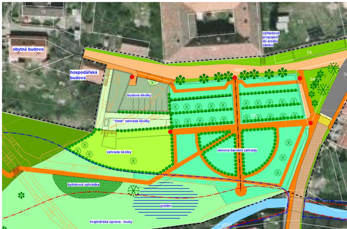
Výkres návrhu územní studie MŠ Státnice - výřez

Navrhovatelka uvádí čtyři území, která podle ní představují alternativu k území Z3-1, ani jedno však není pro postavení školky použitelné.