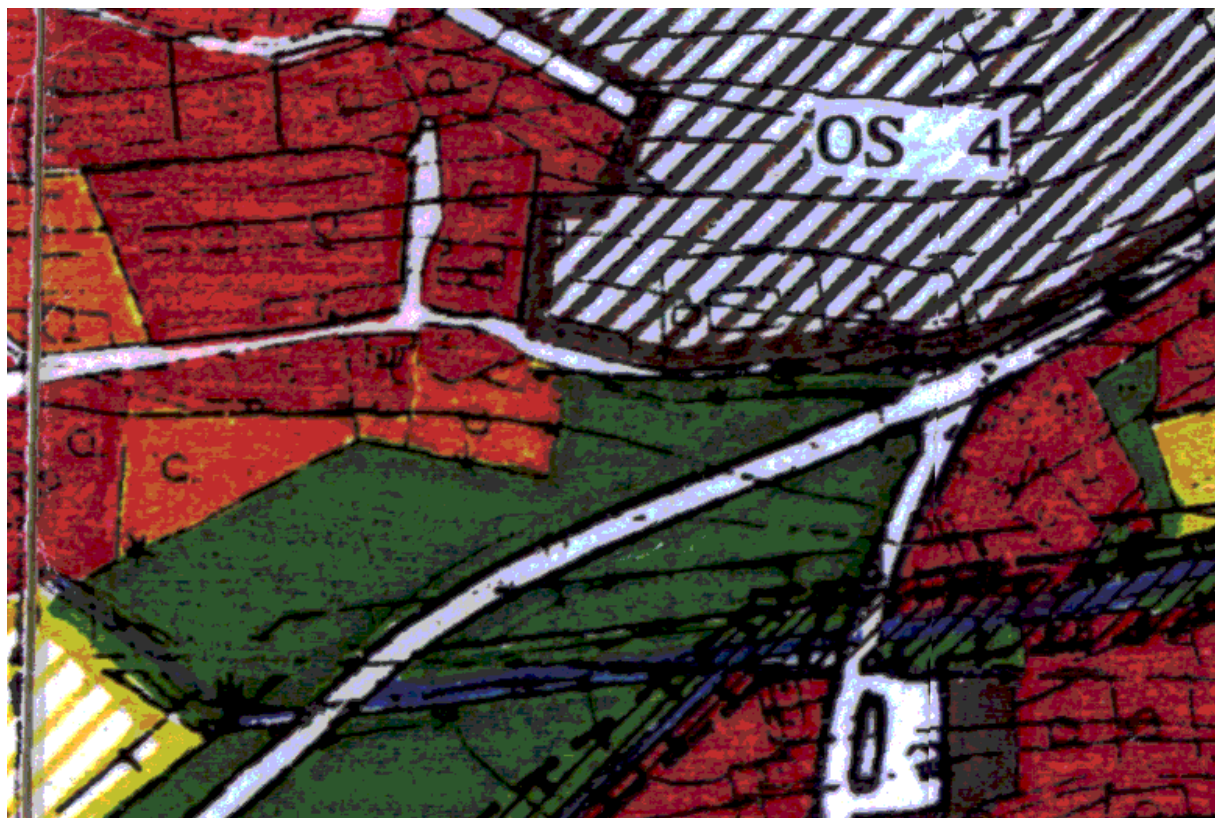
Územní plán z roku 1997 – výřez zobrazující území Z3-1 a jeho okolí