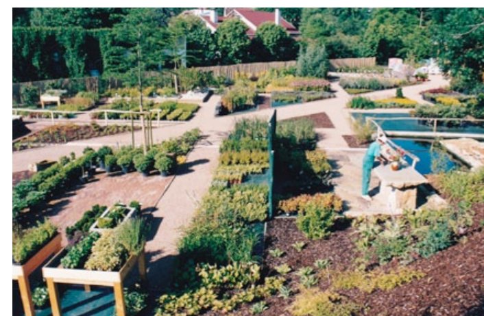
Po otevření prodejní zahrady však začal hýřit barvami a vůněmi.