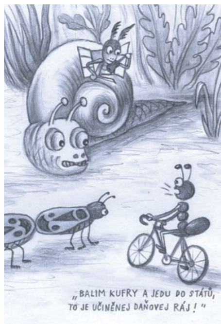
Varianta obálky Zpravodaje na hlavní téma tohoto čísla: Rozpočet v době koronavirové. Nakreslil Jakub Zich.