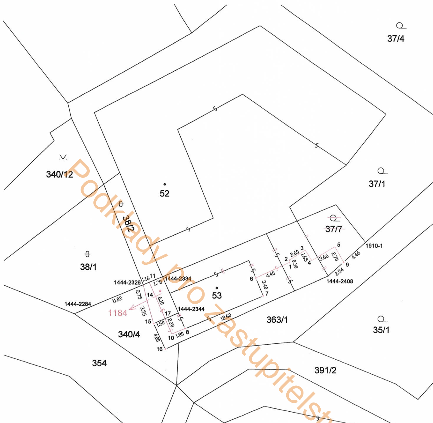
Seznam souřadnic: S-JTSK