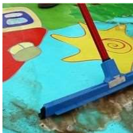
Údržba vodou a běžnými saponáty

Náboj, který vznikne mezi podkladem a vysoce odolnou plachtou ještě znásobí, vlivem tření při pohybu po plachtě a působí jako magnet. Tím zabrání pohybu posunu plachty .