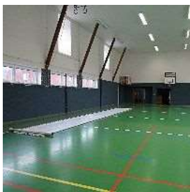
Instalace v interiéru