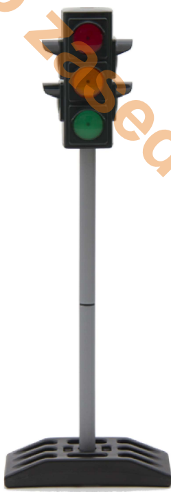
Automatické i ruční ovládání Vlastní zdroj (4x baterie AA) Dešti odolný

S ohledem na stabilitu doporučujeme značky a semafor pro děti MŠ výška 75 cm a pro ZŠ výška max.140 cm.