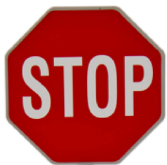
Stůj, dej přednost v jízdě